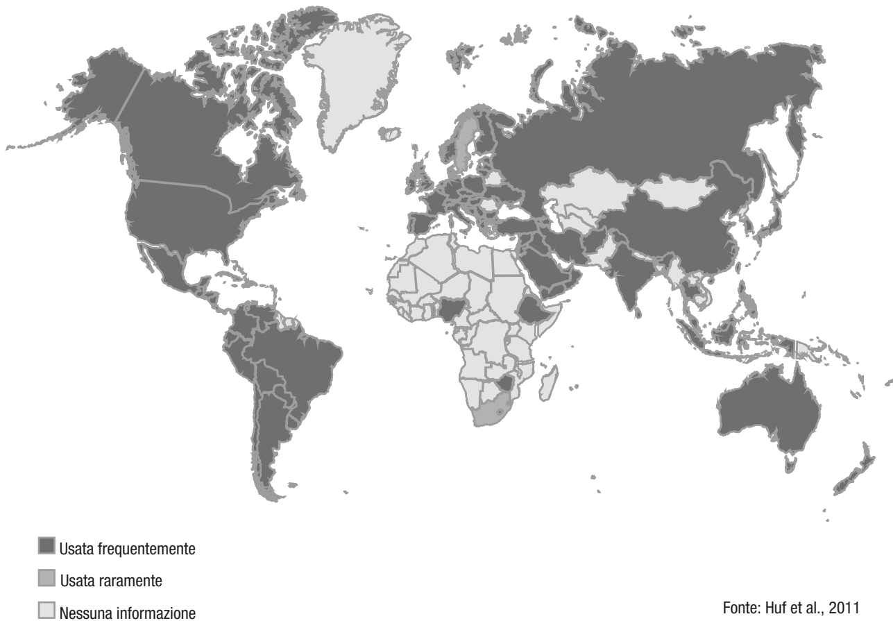
Fig. 2.1 – Diffusione geografica delle pratiche di contenzione