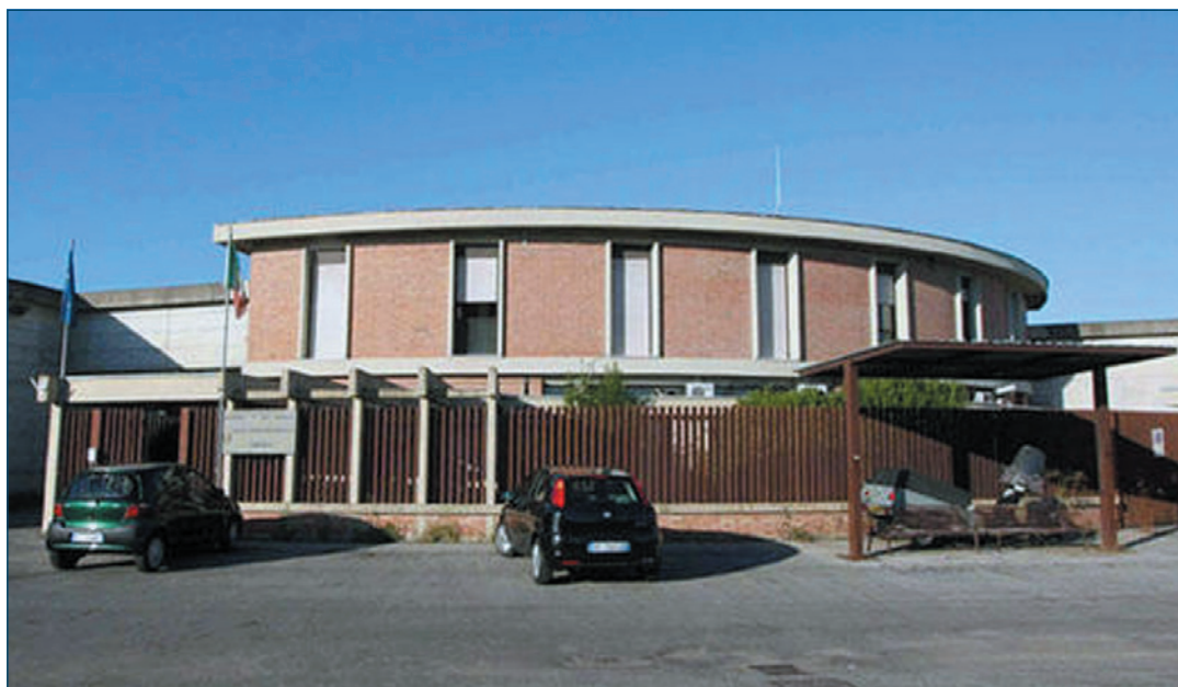
Casa circondariale di Empoli

Nel Carcere circondariale di Empoli sono presenti fra le 15 e le 25 donne, con una variabilità costante, aventi una condanna, o un residuo pena, non superiore a 5 anni. Si tratta di donne con età media di 35 anni di cui metà cittadine italiane e metà straniere (nazionalità prevalentemente presenti: marocchina, cinese, romena, nigeriana, filippina, lituana). L'istituto è caratterizzato da un regime di trattamento avanzato e le persone ammesse devono avere un buon grado di autonomia e di autogestione. La maggior parte di queste è in condizioni di svolgere attività lavorativa non specializzata o con necessità di breve addestramento all'utilizzo di strumenti informatici e software di ordinario utilizzo.