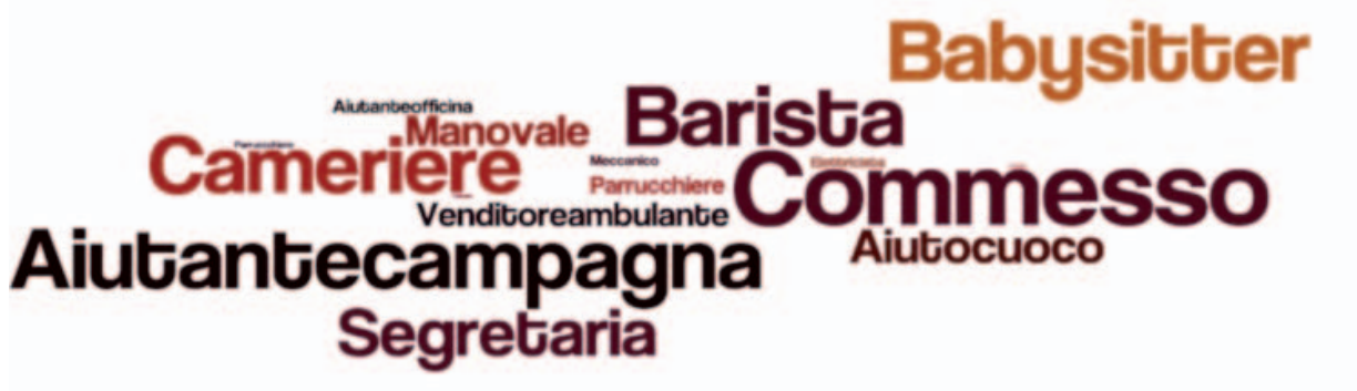
Figura 3 - Le attività principali al di fuori della famiglia

Considerando una batteria di informazioni sui tempi di lavoro (tab. 3), emergono le seguenti tendenze principali: