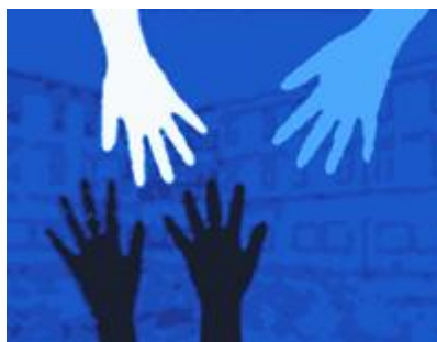
Le logo de l'Unité thérapeutique et éducative de Villabona, en Espagne

E n Espagne, par exemple, un projet-pilote a vu le jour au début des années 90 à Villabona et se poursuit à ce jour. Il réunit au sein d'une unité thérapeutique et éducative (UTE) des « internes » (le terme utilisé pour désigner les prisonniers) intégrés au sein de groupes thérapeutiques d'une quinzaine de personnes, et une équipe multidisciplinaire comprenant gardiens (avec une philosophie de travail complètement repensée et axée sur le relationnel plutôt que sur l'unique surveillance), éducateurs, psychologues, assistants sociaux et enseignants. L'objectif est que chaque détenu soit soutenu et suivi personnellement dans ses démarches, et ce dans une dynamique collective. Au cours de son séjour en UTE, l'interne entreprend « un travail sur soi qui lui permettra d'entrer dans un processus de changement. Il pourra ainsi abandonner ses conduites délinquantes, découvrir d'autres valeurs, apprendre à avoir des relations positives – y compris avec ses proches et son milieu d'origine –, adopter un style de vie plus sain, croître personnellement grâce au contrôle de soi, l'estime de soi, la sincérité et la responsabilité. Le prisonnier est donc pleinement reconnu comme sujet actif de