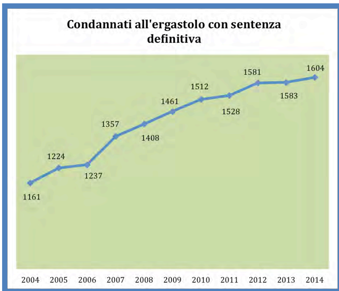
Tab. 2: Unità dei condannati all'ergastolo con almeno una condanna definitiva (dati aggiornati al 30 giugno 2014).